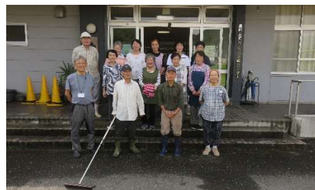
ご参加ありがとうございました