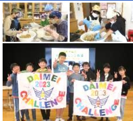
一年間を締めくくりました