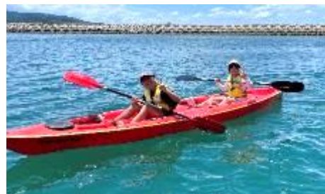
息を合わせて進みます