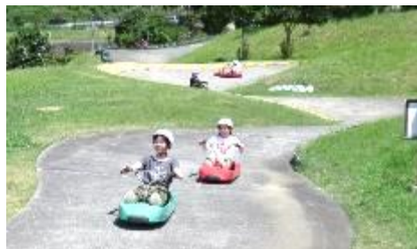
上手にコントロールできています