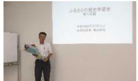
花束を贈りました