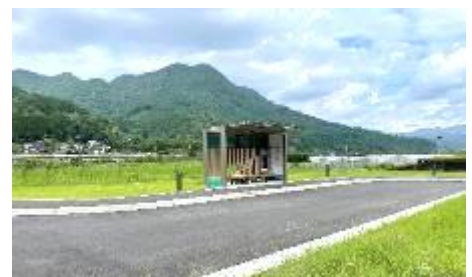
新たに設置された待合所