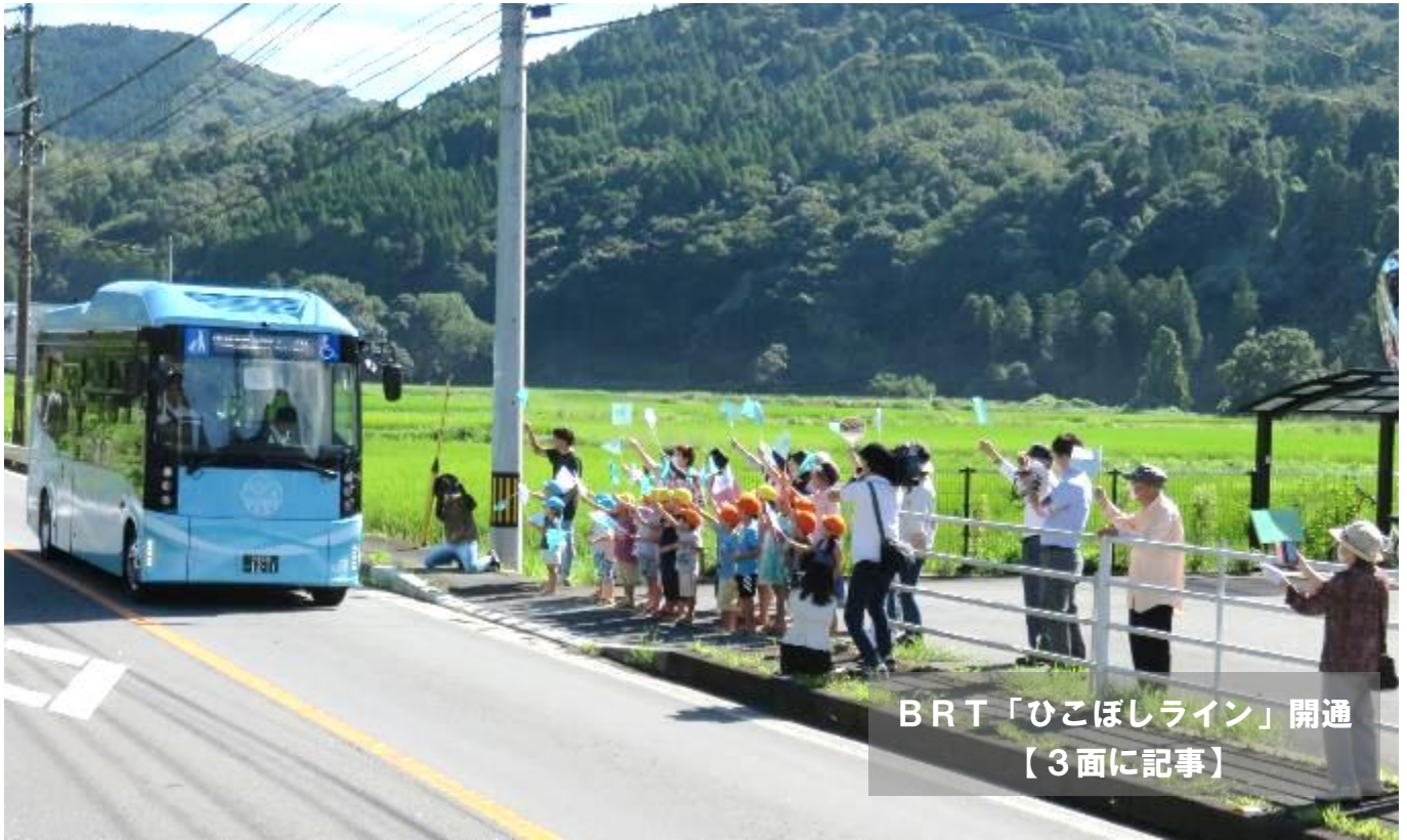
BRT「ひこぼしライン」開通 【3面に記事】

令和5年9月1日 (発行) 日田市夜明公民館 夜明中町 1547 tel27-2122 fax26-6878