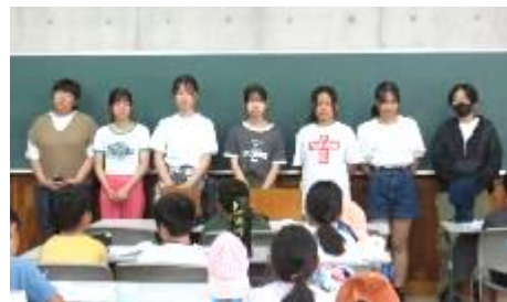
支えてくれた中学生のみなさん