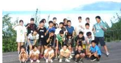
参加したみなさん

今回の合宿では、中学生ボランティアの活躍が素晴らしく、3日間にわたり安全に運営ができるよう、とてもよく支えてくれたおかげで、参加した児童にとっても充実した合宿となったようです。