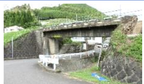
撤去を待つ宮原橋梁

日時：令和5年9月26日（火）10時～13時 悪天候の際の予備日 9月28日（木）