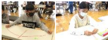
ビーズ編みに挑戦