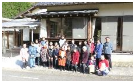
伺った白草（はくそう）公民館