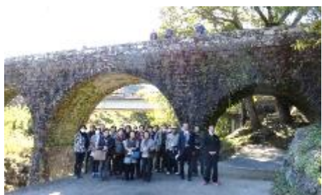
鳥居橋は下を通れます

宇佐市柳ヶ浦では、東光寺五百羅漢を拝観しました。石像が500体以上並んでおり、その個性的な表情を見比べて回りました。安心院町では鰻絵通りを見学しました。院内町では、石橋が70基以上残っており、この中から4カ所ほどを視察しました。残念ながら無くなってしまった大肥橋と重ねるように、当時の石工の技術を偲んでいました。