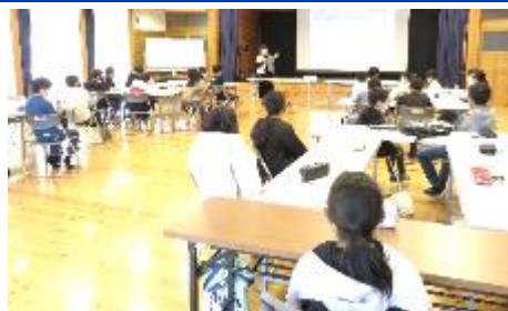
スライドのクイズを考えます

最後に、「紫外線チェックビーズ」を作りました。屋外で紫外線を感じると色が変わるビーズを糸で編みこみ、手軽に持ちまわることができるアクセサリーにもなるようです。