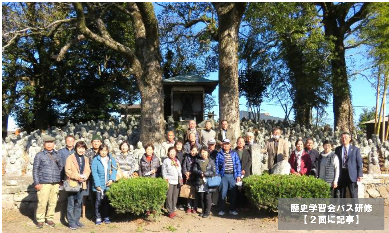
歴史学習会バス研修 【2面に記事】

令和3年12月1日 (発行) 日田市夜明公民館 夜明中町 1547 tel27-2122 fax26-6878