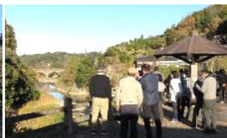
川面に写る分寺橋