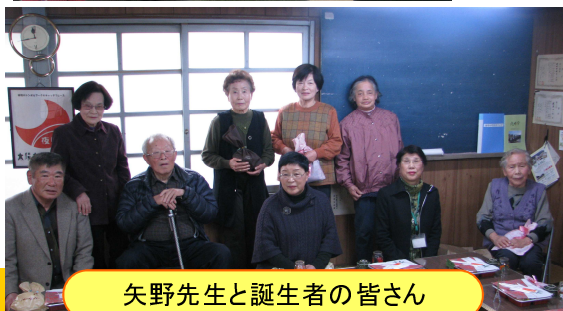
矢野先生と誕生者の皆さん