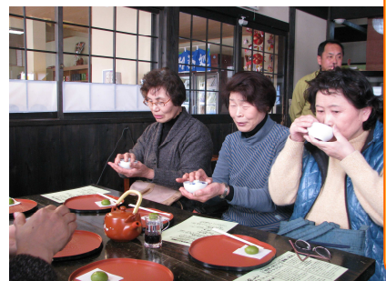
美味しいお茶の入れ方体験