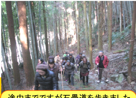
途中までですが石畳道を歩きました

三花地区の「みはな女性セミナー」からお誘いがあり、三日月サークルの運営委員とみはな女性セミナー企画委員の交流会が三花公民館において開催されました。まずは三花地区にある石坂石畳道を皆さんで見学。その後お互いの活動を発表し、最後は一緒に昼食をいただきながら交流を深めました。