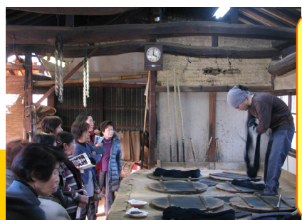
久留米餅の工房を見学