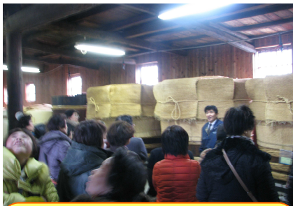
大川市「庄分酢」の蔵を見学

今回のバス研修は、佐賀市から大川市、八女市、広川町を巡り、工場やお酢の醸造蔵、久留米餅の工房などの見学を行いました。