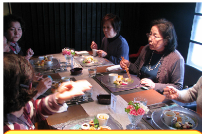
お酢を使った昼食に舌鼓♪