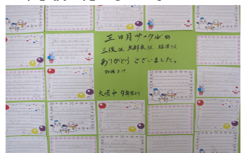
お礼の手紙の寄せ書きを公民館に飾っています

2月14日、大明中学校から郷土料理の指導依頼が三日月サークルにあり、3名の方が9年生の指導に中学校へ伺いました。