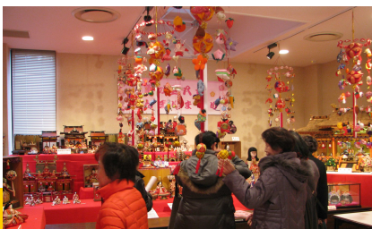
「ぼんぼり祭」が開催中でした