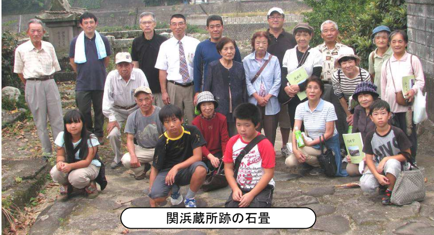
関浜蔵所跡の石畳

9月29日(日)夜明史談会と夜明公民館の共催で、関町夜明遺産巡りを開催しました。