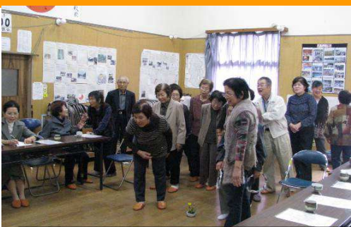
10/17 夜明地区社協「秋の会食交流会」