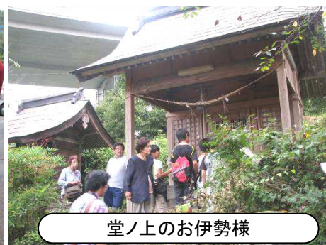
堂ノ上のお伊勢様

今回の夜明遺産巡りには各所ごとに有志の方が来ていただき、解説をしていただきました。