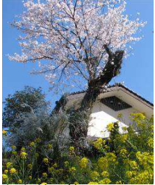
桜と菜の花 花盛りの夜明駅