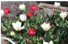
ボランティアの方が 植えていただいた チューリップ