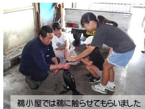
鵜小屋では鵜に触らせてもらいました