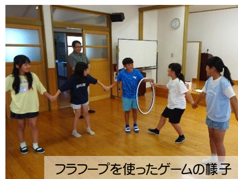
フラフープを使ったゲームの様子

説明を聞いた後は、実際に近くの鵜匠さんのところにお邪魔して鵜小屋を見学。鵜匠さんが毎日えさをあげたり、お世話をしたりしていることを知り、鵜を大切にしていることが分かりました。