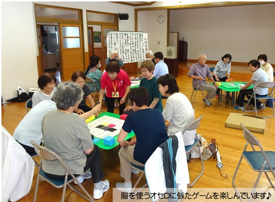
脳を使うオセロに似たゲームを楽しんでいます♪