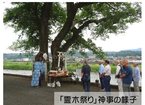
「霊木祭り」神事の様子

この日は神事が行われ、人々を災難から守り、平和と幸福を授ける「棕の霊木」として感謝の念を込めて祈りが捧げられました。