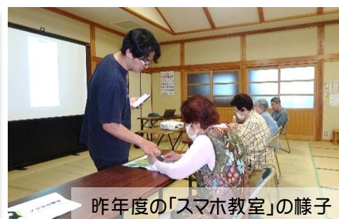
昨年度の「スマホ教室」の様子