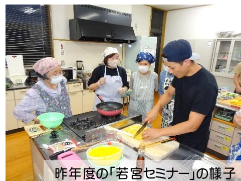
昨年度の「若宮セミナー」の様子

只今教室生を募集中です！詳しくは、本紙と一緒に世帯配布(若宮校区のみ)しております募集チラシをご覧ください。募集チラシは、公民館のホームページからもご覧になれます。若宮公民館ホームページ www.hita-k.org/wakamiya/