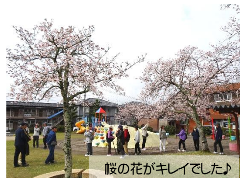
桜の花がキレイでした♪