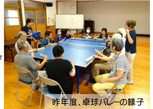
昨年度、卓球バレーの様子