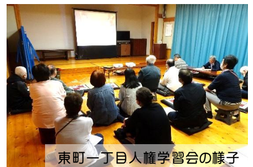
東町一丁目人権学習会の様子

待・同和問題・発達障害・子どもの虐待・精神疾患など、様々な人権問題に直面したとき、自分ならどうするかを考えてみる内容のDVDを視聴。いろいろな種類の人権問題がある事を学びました。