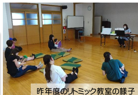
昨年度のリトミック教室の様子