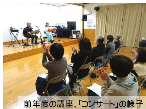
前年度の講座、「コンサート」の様子