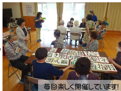
毎回楽しく開催しています！

のお手伝いをしていただけるサポーターを募集しています。興味のある方は、若宮公民館までお問い合わせください。