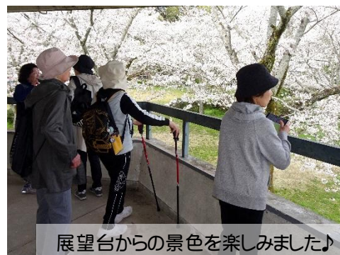
展望台からの景色を楽しみました♪