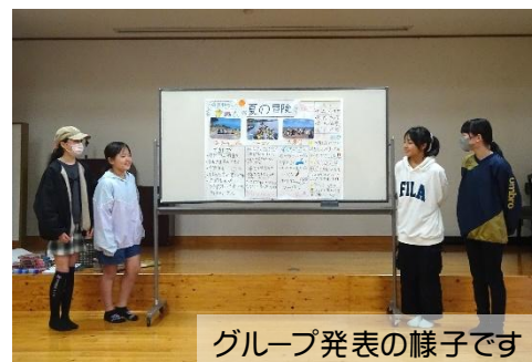
グループ発表の様子です

室」は17名の子ども達が参加、そのうち5名が全ての活動に参加してくれました♪ 1年間「スクラム教室」で体験したことを忘れないで、これからの生活に活かしてもらえると嬉しいです。