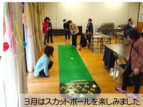
3月はスカットボールを楽しみました