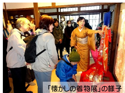
「懐かしの着物展」の様子