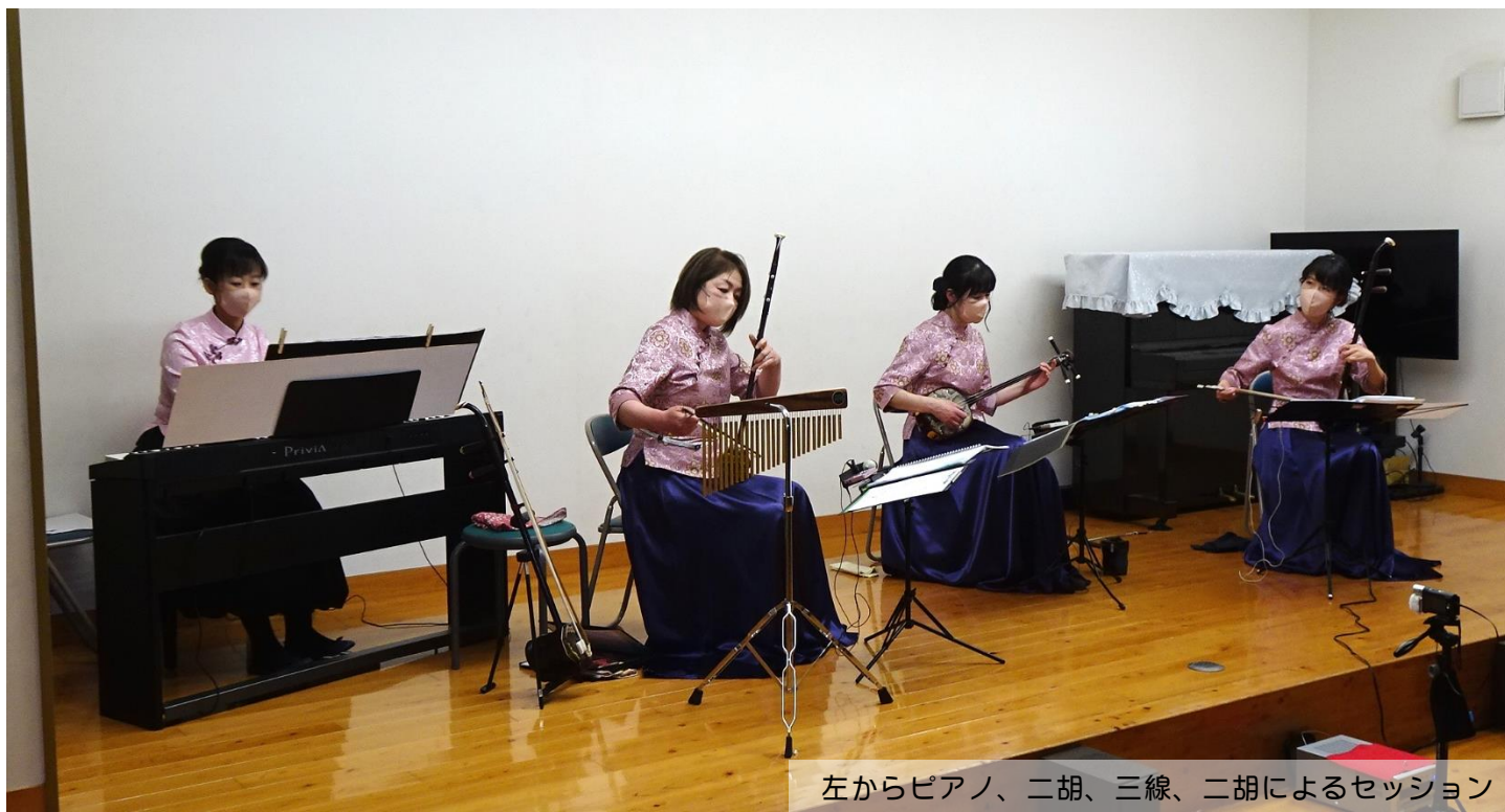
左からピアノ、二胡、三線、二胡によるセッション