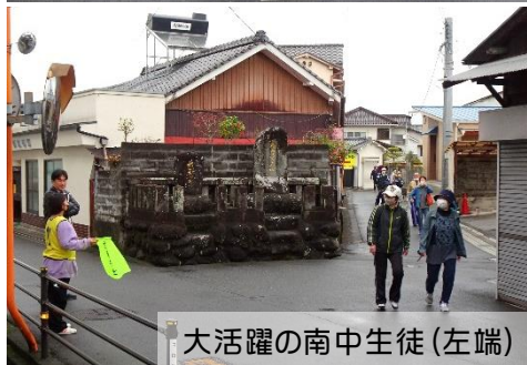
大活躍の南中生徒(左端)