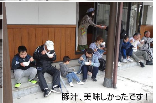
豚汁、美味しかったです!