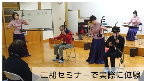
二胡セミナーで実際に体験

めったに聴くことができない二胡の生演奏。とってもキレイな音色で参加者の皆さん、心が癒されたようです。