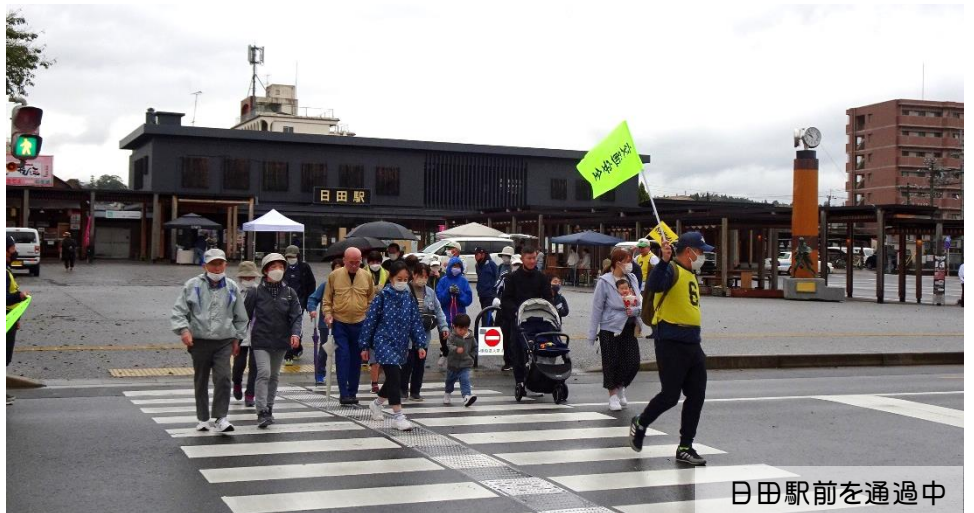
日田駅前を通過中

今回の開催にあたり、若宮スポーツ協会、および南部中学校の生徒にスタッフとしてお手伝いしていただきました。また、公民館料理教室の方に豚汁を作っていたいただき、ゴールの後に皆さんに提供しました。雨降