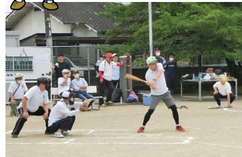
熱戦が繰り広げられました!