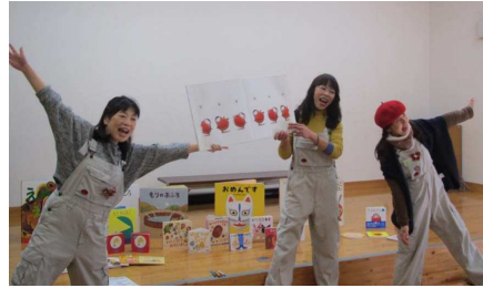
人気絵本シリーズ「だんるまさん」を手 にポーズを決めると子どもたちも一緒 に……

1月の子育てサロンで、市内で絵本の 楽しさなどを伝える活動を行っている工 ホントの皆さんをお招きして、絵本を読 もつーを行いました。エホントの皆さん は舞台上には様々な絵本を並べ、今日 は何を読んじゃおうかな?と、この日