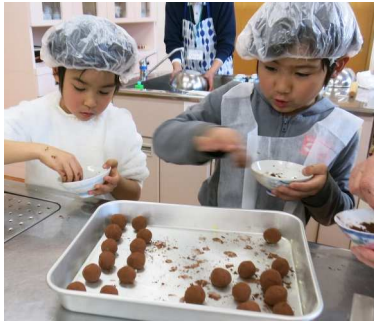
ココアパウダーをまぶす作業は とっても真剣な顔つきでした

2月の最初の講座では、こち らでもチョコ菓子づくりをしま した。栄養面を意識したチョコ 菓子という事で、蒸したさつ もいもをつぶして、ココアパウ ダーをまぶした「ココアポー