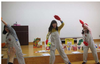
チビっ子たちに人気のユニット・ケロボンズの エビカニクスがかかると子どもだけでなく 大人もノリノリで踊っていました

涙するものなどたくさんあります。小さな子どもさ んだけではなく、ちょっと疲れたな……、という時 にもおすすめです。