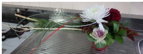
も才感 て、な 綺麗、感 シャシ じです。