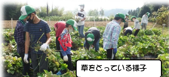
草をとっている様子