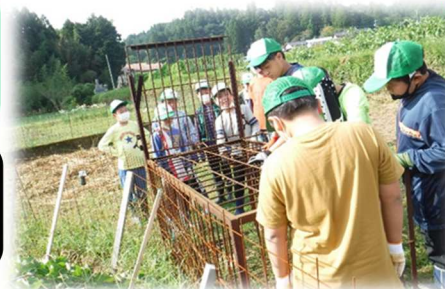
イノシシの餌を観察する様子