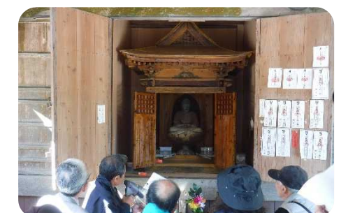
(一昨年フィールドワークの様子)

◇申込方法 下記の申込み用紙に必要事項を記入し、11月4日(木)高瀬公民館までご持参、 もしくはFAX(24-4075)して下さい。 お問合せ 高瀬公民館☎24-2705