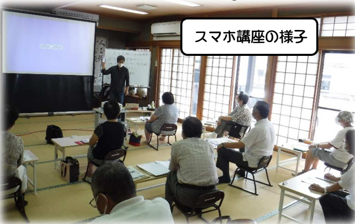
スマホ講座の様子

9月7～9日午前中、新規講座の「スマホ駆け込み寺(第2弾)」が開催されました。初日はマナーモードの設定の仕方や SMS※について学びました。受講生は「自撮りの仕方が知りたい」「データを消す方法がわからない」など積極的に先生へ質問をしており、とても有意義な講座となりました。最終日のアンケートでは「分からなかったことが一つ一つ理解できて有難かった」「次回も参加したい」「初心者だけの講座を開いてほしい」などの感想がありました。