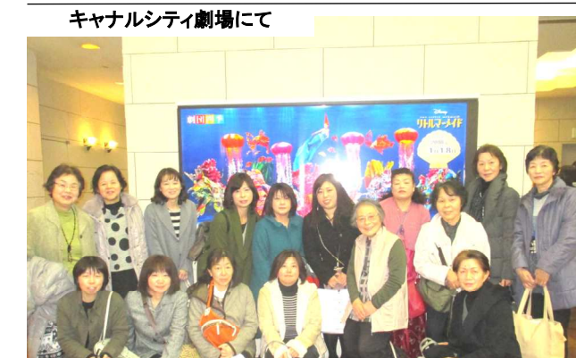
キャナルシティ劇場にて

好みの色のしめ縄や造花等で飾りつけ、各々、素敵なお正月飾りが完成しました！ よい新年を迎えることが出来たのではないのでしょうか。