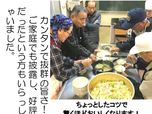
ちょっとしたコツで驚くほどおいしくなります！

★手造りウインナー 1月27日(土)はバス研修で福岡県糸島市へ。 糸島手造りハムで、ウインナー造りを体験！800g程も持ち帰りました。良いい土産が出来ましたね！