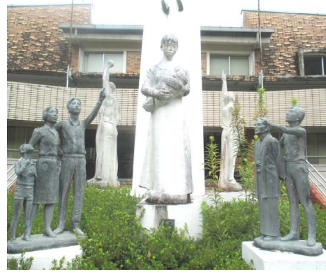
「愛の願い」と「町民群像」

…そして月日は流れ、この2月で「みんなの願い像」が建てられてから39年が経過します。この度の庁舎解体に伴い、シンボルタワーはやむなく壊されることとなりますが、像は大山振興局(旧大山小)に移設されるそうです。