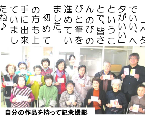
自分の作品を持って記念撮影

◆人権学習 ★北部自治会人権学習会 1月25日(木)、北部コミュニティセンターで、ワトルマーメイド館長が基本的な人権と人権学習会についてお話しさせていただきました。