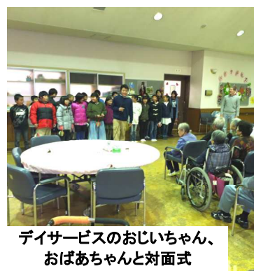
デイサービスのおじいちゃん、おばあちゃんと対面式

クリスマス飾りを持って、福祉センターへ。デイサービスののじいちゃん、おばあちゃん達は、子ども達の訪問とプレゼントをとっても喜んで下さいました。一緒に食事、お話をし、とても良い交流ができました。