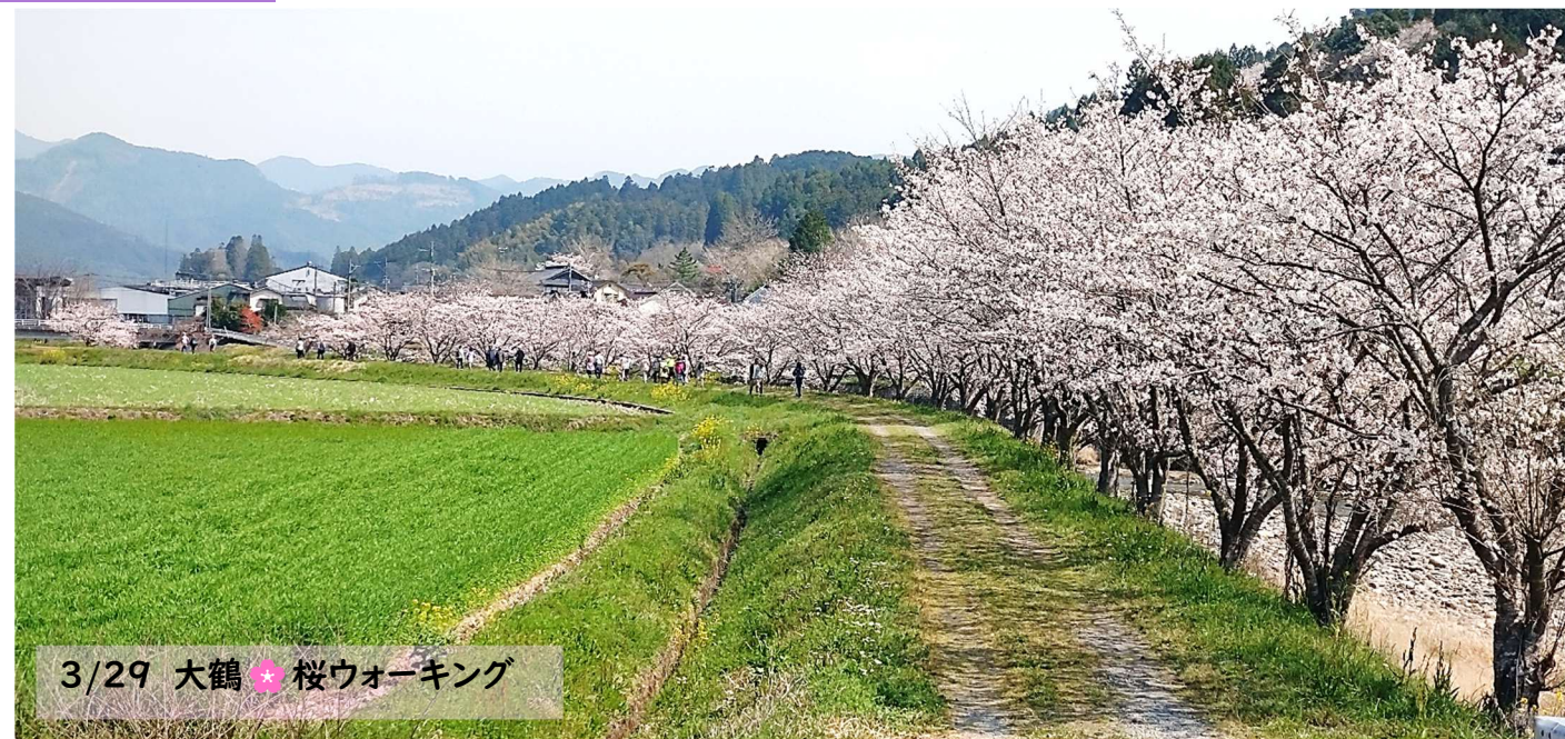
3/29 大鶴 ☆桜ウォーキング