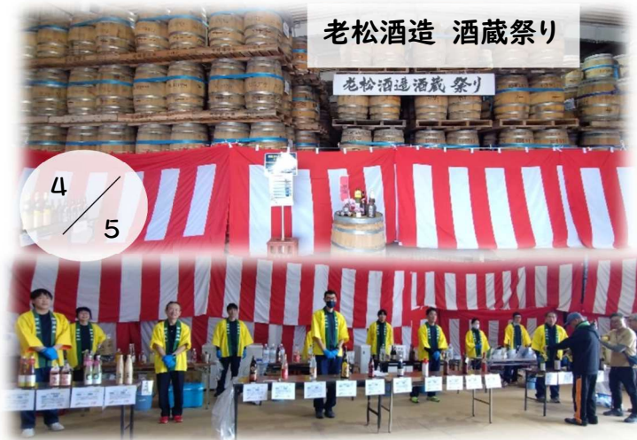
老松酒造 酒蔵祭り