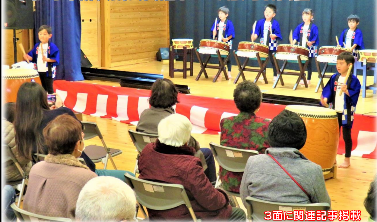
3面に関連記事掲載