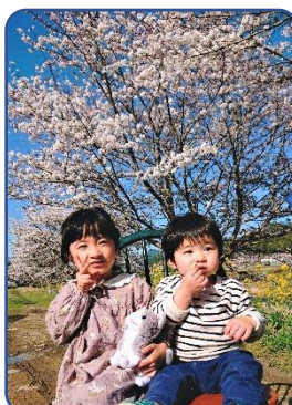
⑳ すずとたつちゃん