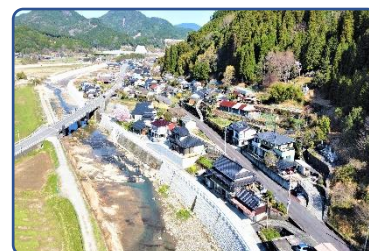
⑯ 私の宝 ふるさと