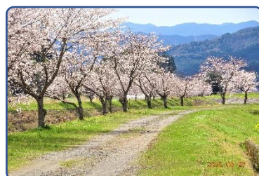
⑮ 大肥川 只今春爛漫②