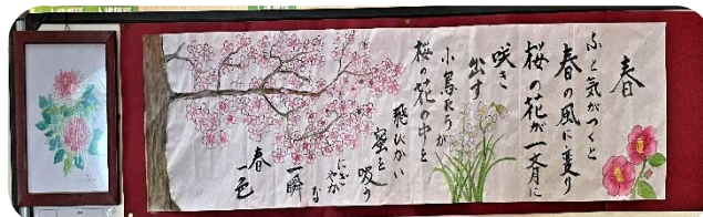
絵画 作品番号 1.2