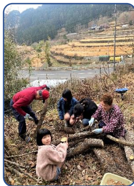
② じいちゃんとシイタケの駒打ち