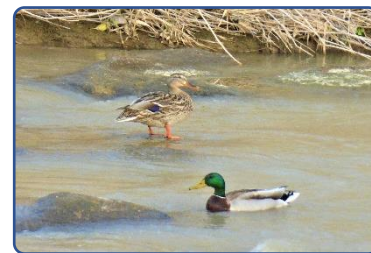
⑪ カモ カモエブリバディ

下記のQRコード読取ると http://mail-to.link/... が記載されますそれをタップすると画面が表示されます。メール作成画面はこちらをタップすると下の画面になります。