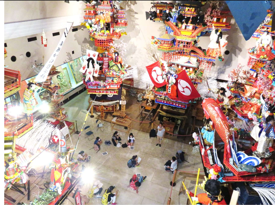
大明チャレンジ教室 列車でGO!「日田めぐり」を開催しました。(詳しくは4ページ)