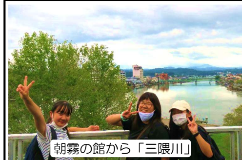
朝霧の館から「三隈川」

新型コロナウイルスに関する相談窓口を日田市が開設しています。電話0973-22-8243