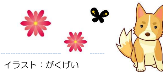
イラスト: がくげい

20日(木)ひたPAYのこと聞いてみよう! 24日(月)小野公民館運営委員会【総会】 27日(木)犬の予防注射(日田市環境課) ※小野公民館駐車場 14:15~14:25 28日(金)ウォーキング教室