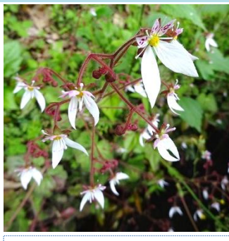
上:ユキノシタ 左うえ:テイカカズラ 左した:ガクウツギ 下:イヌバラ