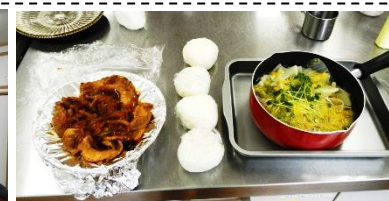
上・左写真ともに R4.3月料理教室時の様子