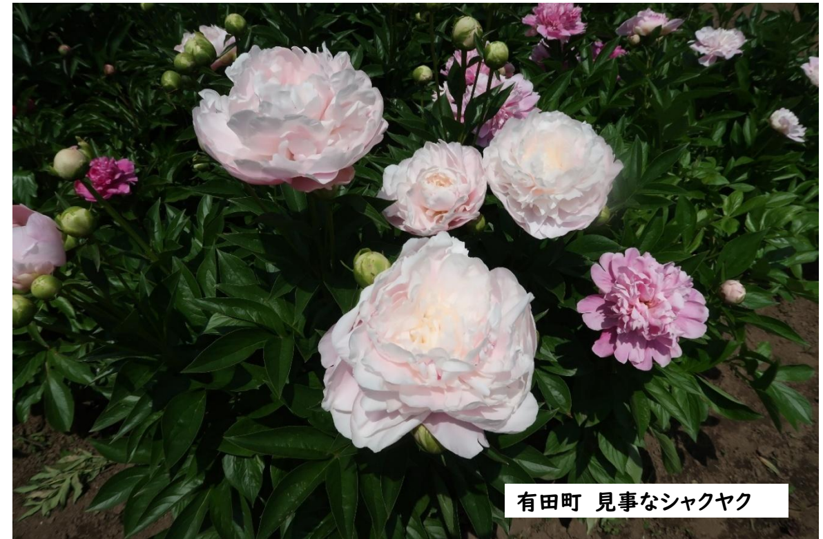
有田町 見事なシャクヤク