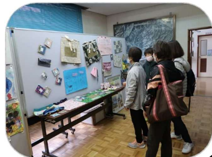
写真は昨年の様子