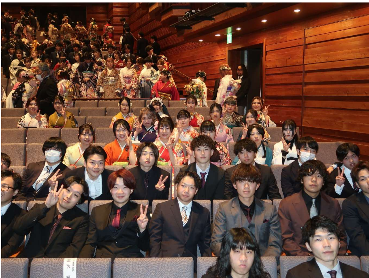
『20歳のつどい』の様子、詳しくは裏面に