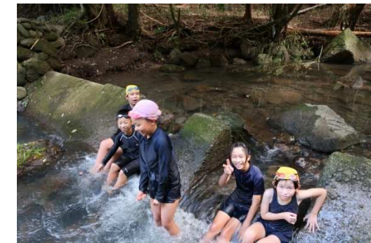
石松川で水生生物調査と水遊び