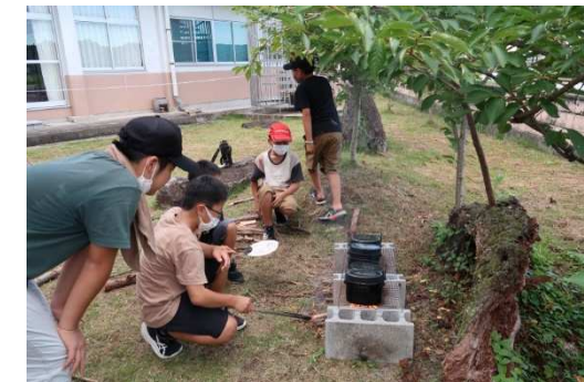
食事の準備も自分たちだけで

7月28日(木)・29日(金)の1泊2日の日程で、3年ぶりにサマーキャンプを実施しました。新型コロナウイルスのため市外キャンプ場においてのキャンプは難しいとの判断から公民館に宿泊りするタイプへと変更しました。 キャンプ中は12名の有田っ子が互いに協力しながら様々な野外活動を体験し、集団生活を通して、思いやりや協調性を学び取ったようです。 また、本キャンプのため地元住民の多くの方がボランティアとして参加協力して頂き、ありがとうございました。 活動中の様子を、ほんの一部ですが紹介します。