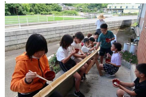
↑そうめん流しとスイカ割り↓