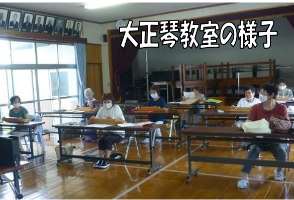
大正琴教室の様子

7月に『西有田将棋クラブ』が新規開講し、参加者を募集中です！ また、現在、西有田公民館では13教室が活動しています。コロナ禍で例年のように参加募集が出来ないのですが、ご興味あればお問い合わせください！また、新規開講についてのご相談も遠慮なく、お待ちしております！