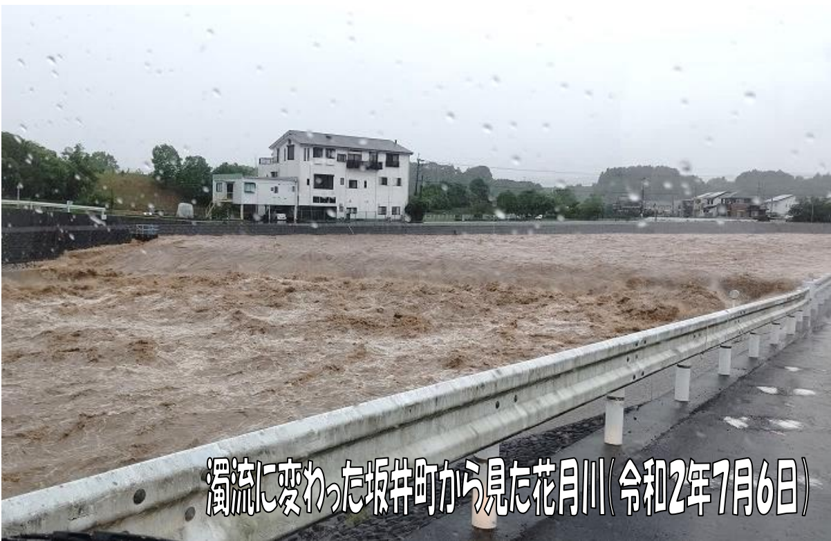
濁流に変わった坂井町から見た花月川（令和2年7月6日）