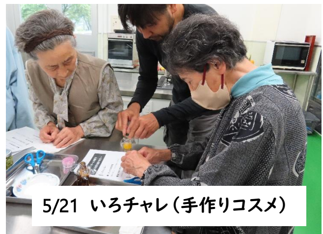
5/21 いろチャレ(手作りコスメ)

今年度のスイーツ教室も始まりました🍇今回はドライフルーツカップケーキです。材料も工程も極力簡単に！自宅でも何度も作れるレシピです。“茶摘み”も歌い初夏を感じました。