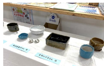
昨年度の様子と作品