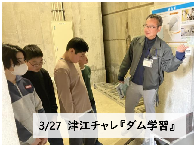
3/27 津江チャレ『ダム学習』

令和7年度最後の料理教室は、和スイーツ！ということでいちご大福とわらび餅を作りました🍓いちご大福はアツアツの求肥ですぐに包んでいかなければならなかったのですが、皆さんの手際でころんと可愛くあがりできました。