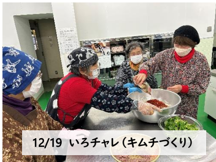
12/19 いろチャレ(キムチづくり)

むらづくり役場のまなぶ・くらす部会さんを中心に、熊本市へ先進地の視察研修に行ってきました。ボランティアガイドの方から、熊本城についての詳しい案内と共に、なぜガイドになろうとおもったのかをお話いただきました。地域に根差した活動についてや、中津江の方にとってなじみある熊本についてさらに理解の深まった研修となりました🌸