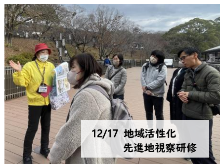
12/17 地域活性化 先進地視察研修

今回のハンドベルは2曲目が前回よりすこし難易度アップ。両手にちがう音のベルを持ちます。しかし最初はごこちなかった音が、数回で揃うように！綺麗な音色に包まれながら、先生も一緒に楽しく笑って素敵な時間になりました🌟