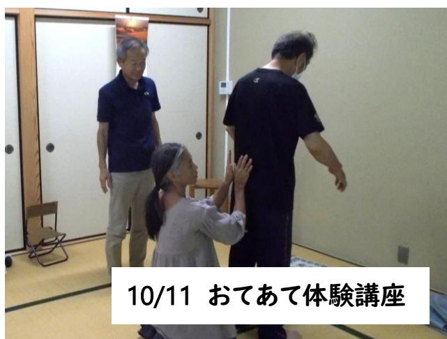
10/11 おてあて体験講座

今月のおとな食堂は秋メニュー！きのこのこのおこわをメインに、彩り玉子焼きなどを作りました。もちろん地元野菜がいろいろ使われているので、調理も実食も津江の秋を感じました🍁