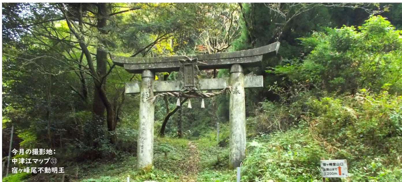
今月の撮影地： 中津江マップ③ 宿ヶ峰尾不動明王