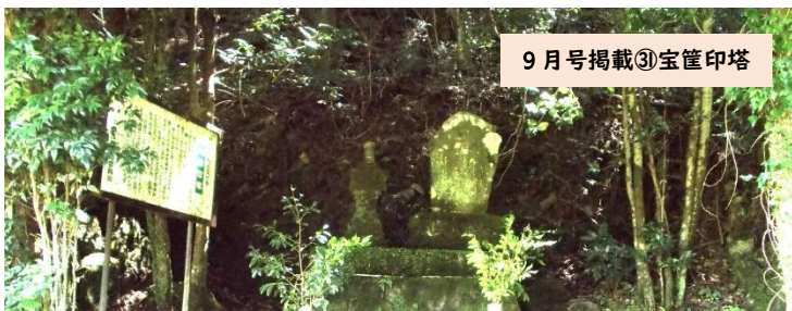
9月号掲載③宝筐印塔

今年度より中津江公民館だよりの表紙にしばしば掲載しています、中津江村内各地の名所。