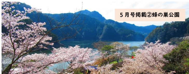
5月号掲載②蜂の巣公園