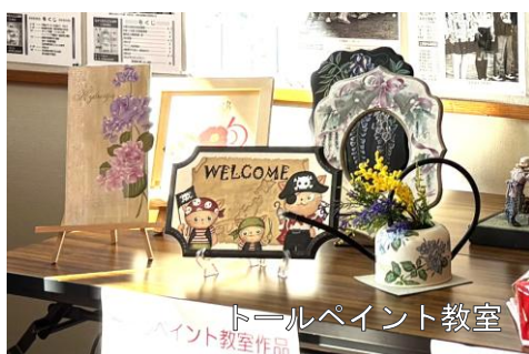
トールペイント教室