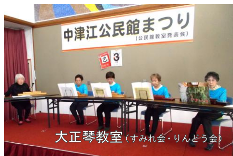
大正琴教室(すみれ会・りんどう会)

3月9日(日曜日) 昨年同様とても良い晴天の日に、令和6年度中津江公民館まつり(教室発表会)を開催。日頃から中津江公民館で活動している自主学习教室のステージ発表や作品展示にくわえ、地域で活動している団体も参加、おとな食堂によるカレー等の提供、特別ゲストの公演もあり、大盛り上がりの1日となりました。 中津江パワーを目で、耳で感じてもらえる時間になったのではないのでしょうか👏😄