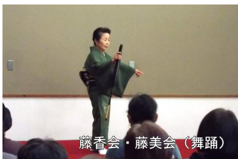
藤香会・藤美会（舞踊）