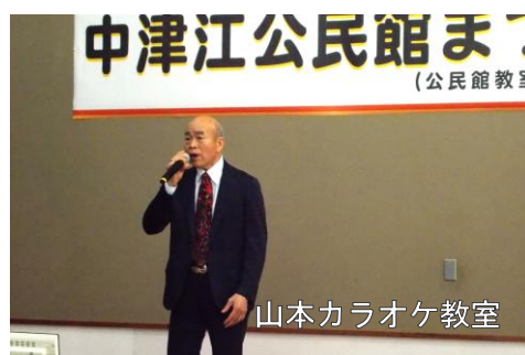
山本カラオケ教室