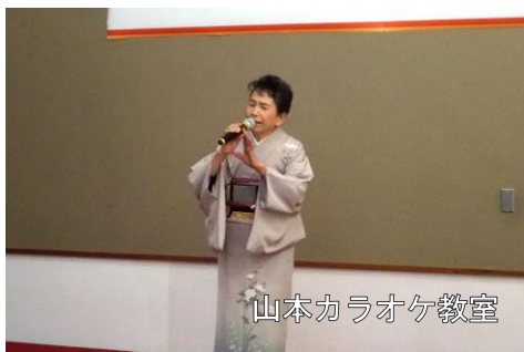
山本カラオケ教室