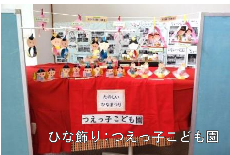
ひな祭り：つえっ子こども園