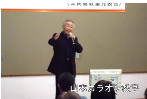
山本カラオケ教室