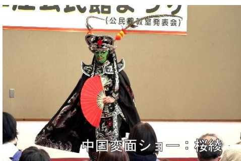
中国変面ショー：桜綾