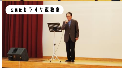
公民館ラオク夜教室