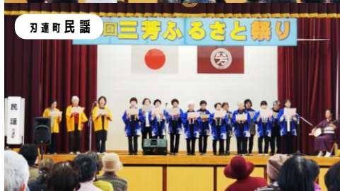
刃連町民謡 三芳ふるさと祭り