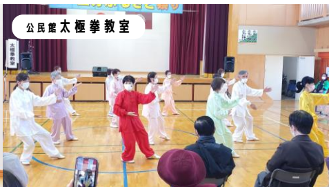
公民館太極拳教室