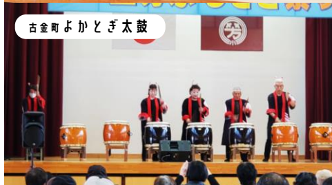
古金町よかとぎ太鼓