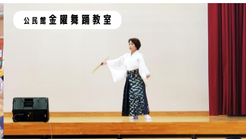
公民館金曜舞踊教室