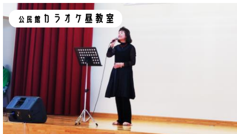
公民館ラオク屋教室