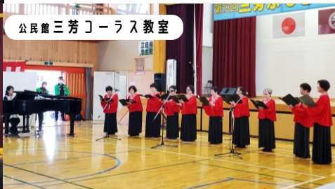
公民館三芳コーラス教室