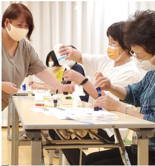
三芳公民館／主催事業／成人セミナー第1講

座ったままでも十分に「効いている！」と実感できる体操が多く、楽しくそれでいて効果抜群の講座となりました。参加された方々はご自宅に帰ってから是非継続して行ってほしいと思います。