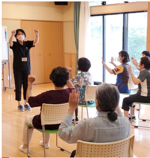
三芳公民館／主催事業／久津媛クラブ第1講