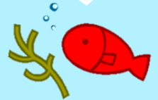
イラスト ©がくげい