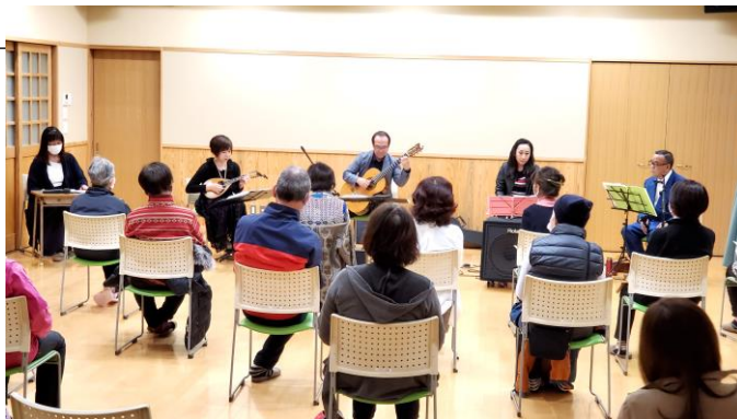
▲はじめは演奏者の皆さんも、参加者も緊張した面持ちでしたが、知っている楽曲が演奏されるにつれ、リラックスして生演奏を楽しんでいらつやいました。最後にはアンコールも！※写真はマスクを外しているときに撮影したものです。

コロナ禍ですっかり遠出やイベント参加もできなくなっている昨今、生演奏を聴ける機会も減りつつあります。そんなコロナ疲れの頭に心地よく響く生演奏会となりました。