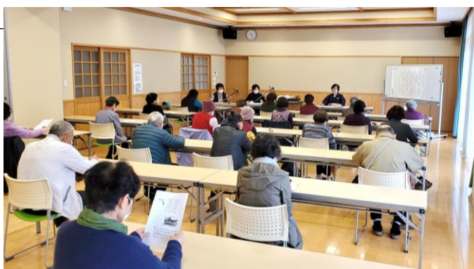
▲「コソコソ節」「日田の子守歌」「ぞうめき」など、中には参加者のみなさんが知らない日田の古謡も。古謡にこめられた当時の生活の様子や、歌詞のユニークさなどから、様々な思いが伝わってきます。

古謡の時代背景などの説明を交え、参加者が相槌できる古謡から、そうでない古謡まで、日田市の歴史をめぐる、学習できる貴重な講座となりました。