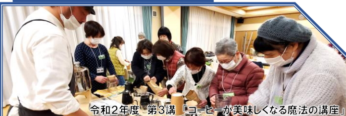
令和2年度 第3講 「コーヒーが美味しくなる魔法の講座」