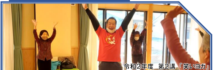
令和2年度 第2講 「笑いヨ力」