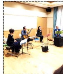
講師 日田マンドリンギターアンサンブル 日田市を中心に活動されているアンサンブル。日田市公民館各所で演奏会を通して、演奏の楽しさや、コロナ禍の癒しを提供している。