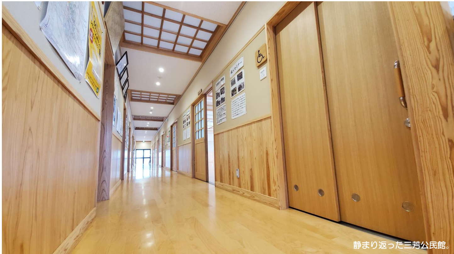
静まり返った三芳公民館。