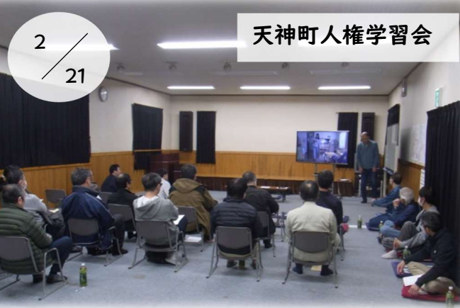
天神町人権学習会

三花公民館運営委員会の常任委員会を開催し、来年度の予算や事業計画について協議しました。来年度も円滑な事業運営に努めていきます。