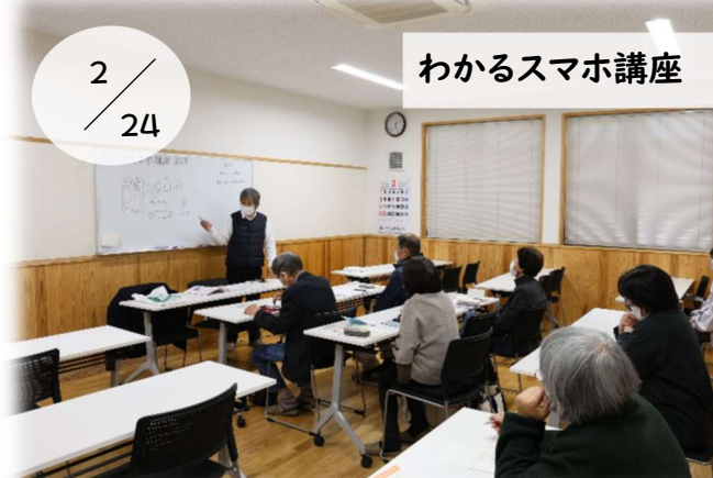
わかるスマホ講座

日常の思い込みから生じる人権問題について学ぶ研修を行いました。自分や相手を尊重し、相手の立場に寄り添ったコミュニケーションの大切さを考える機会となりました。