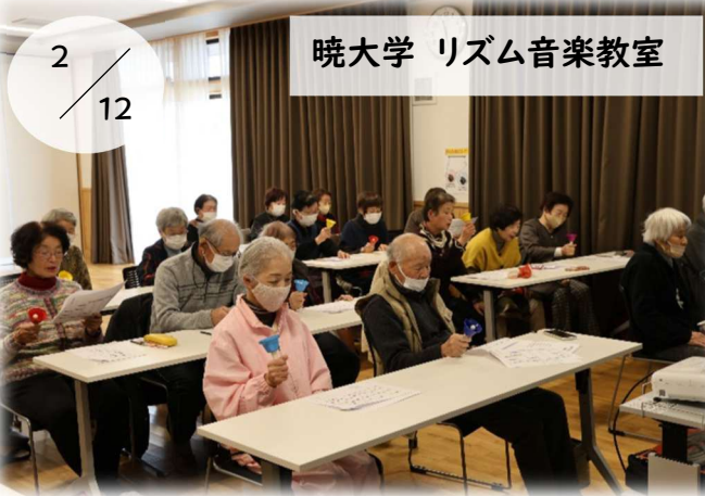
暁大学 リズム音楽教室

男の料理教室で、豚肉とごぼうのマヨみそ炒め、さわらのみぞれ煮、かぼちゃのスコーンを作りました。教室生は慣れた手つきで調理を進め、楽しく学びました。