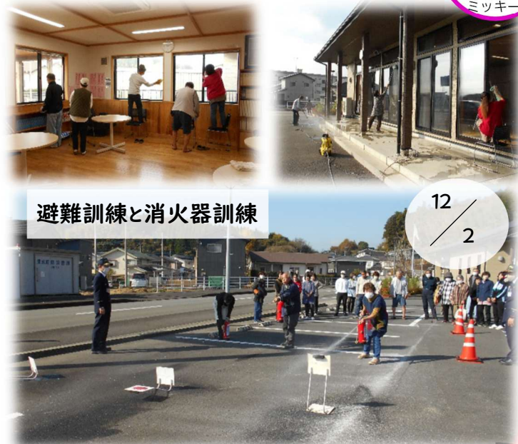
避難訓練と消火器訓練