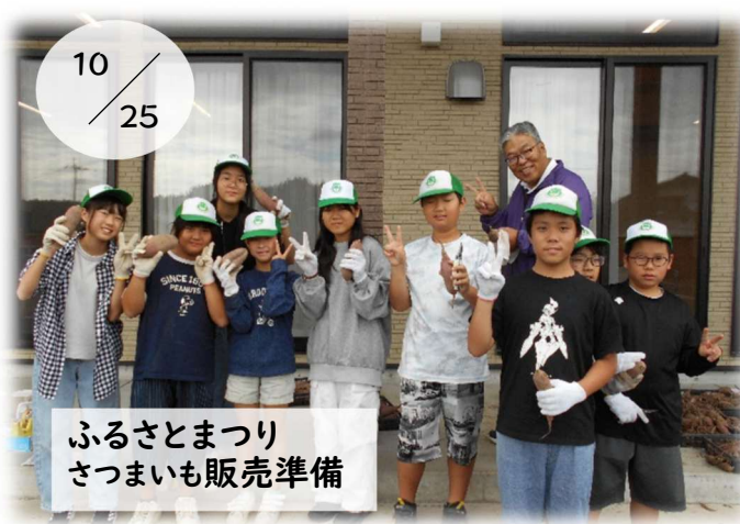
ふるさとまつり さつまいも販売準備