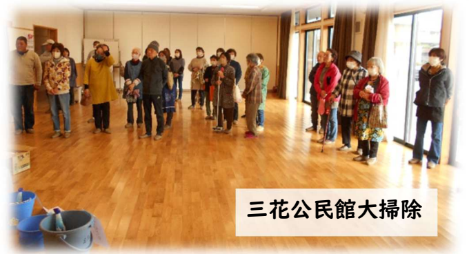
三花公民館大掃除

毎年恒例の大掃除・避難訓練・消火器訓練を三花公民館で行いました。大掃除では、今年度新たに購入した高圧洗浄機を使い、網戸をすみずみまできれいにすることができました。また、消火器訓練では、参加された皆さんが真剣な表情で取り組み、防災への意識を高める良い機会となりました。