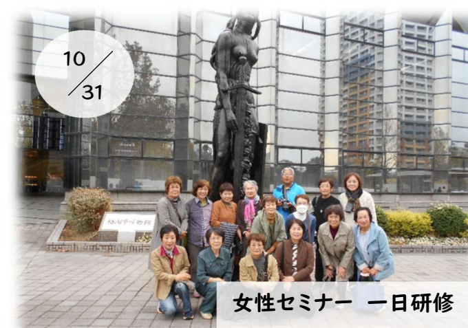
女性セミナー 一日研修

三和小学校において家庭科のミシン学習に地域ボランティアが参加しました。児童はボランティアに質問しながら作業を進め、先生だけでは行き届かない見守りや支援が行われました。