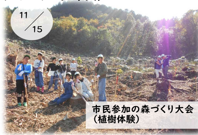
市民参加の森づくり大会 (植樹体験)