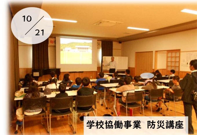
学校協働事業 防災講座

三和小学校3年生の防災講座を三花公民館で館長が担当しました。私たちの地区の過去の水害映像などを見て、早期避難の大切さや防災意識が芽生えた様でした。