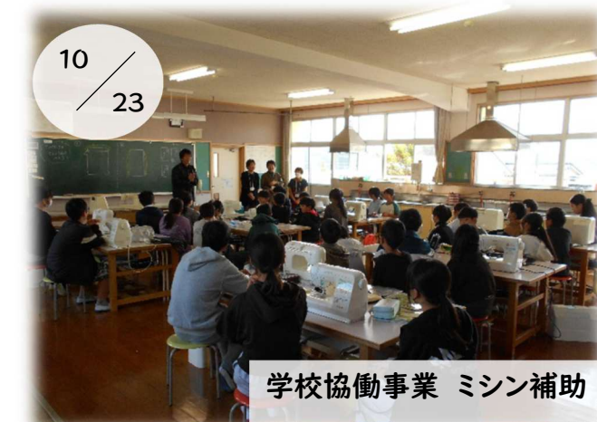
学校協働事業 ミシン補助

三和小学校3年生の防災講座を三花公民館で館長が担当しました。私たちの地区の過去の水害映像などを見て、早期避難の大切さや防災意識が芽生えた様でした。