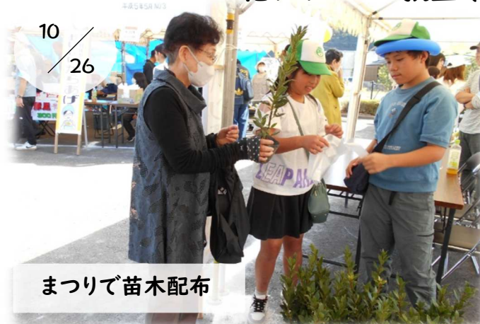
まつりで苗木配布