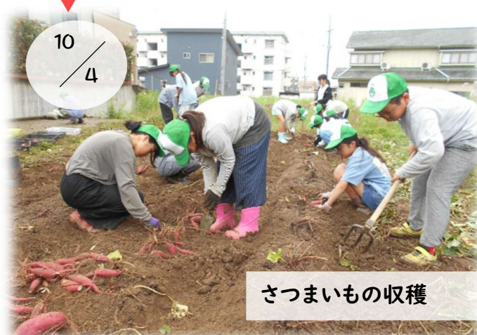
さつまいもの収穫