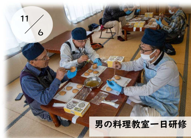
男の料理教室一日研修

みはな女性セミナーで、福岡市博物館と福岡管区気象台を見学しました。博物館では、国宝「金印」のレプリカを間近で見学し、歴史への理解を深めました。気象台では、気象庁の仕事や天気予報の仕組みについて学習し、参加者の皆さんも熱心に耳を傾けていました。