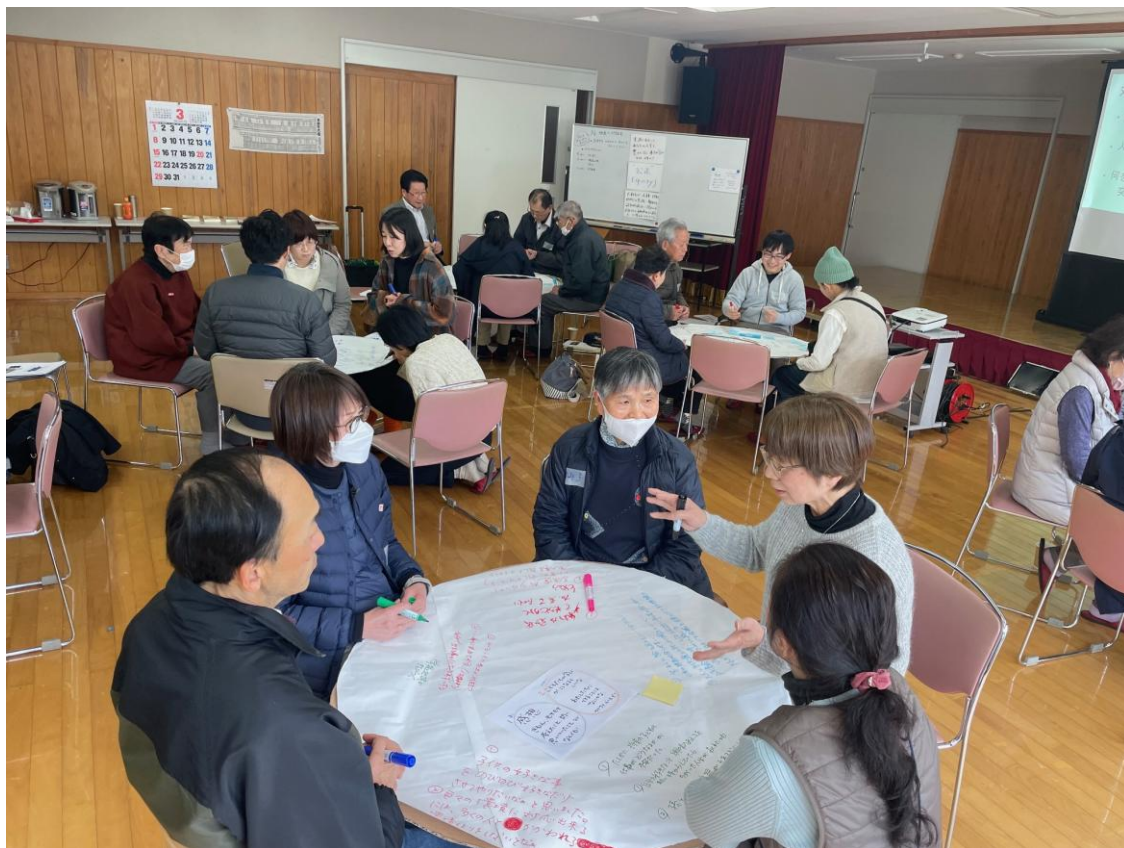
前津江の学校について大いに語り合いました!!! これからの前津江を考える!映画上映会&対話会(3/8)