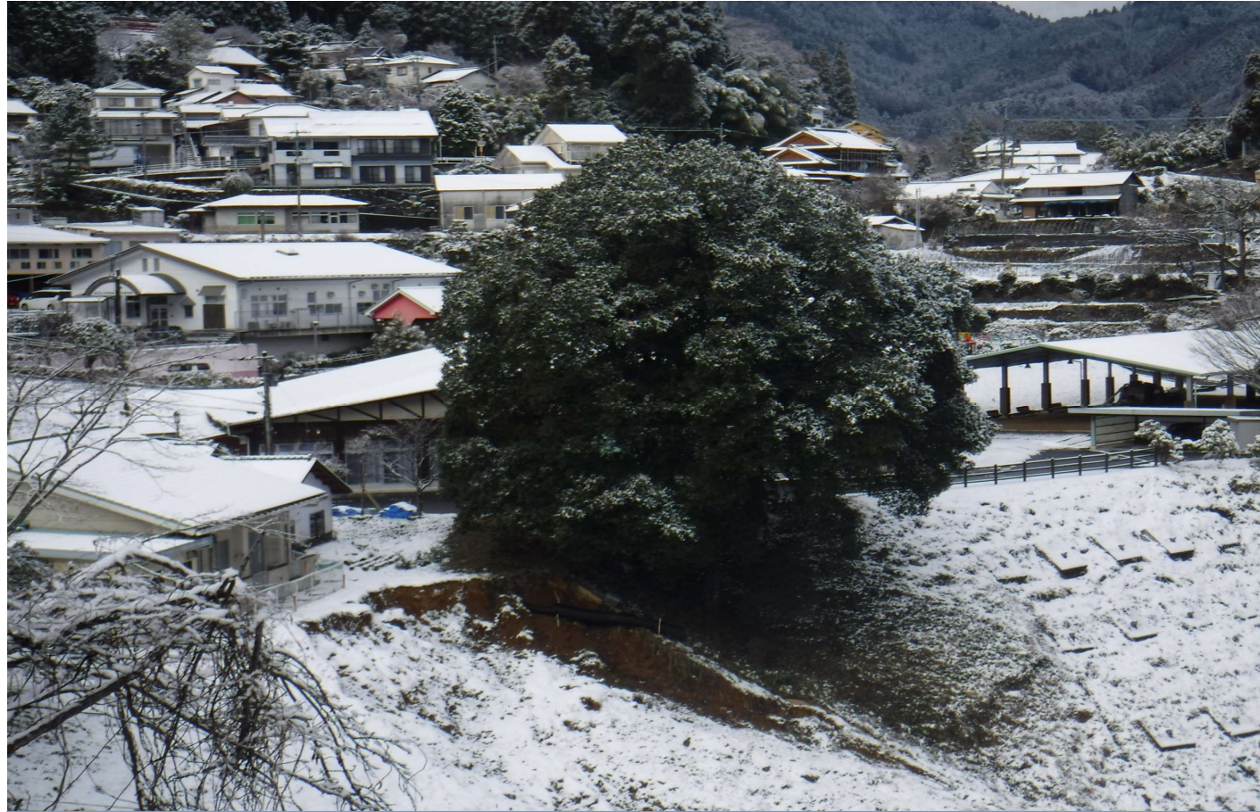
公民館前のシラカシ?を中心に 1 月 12 日(火)降雪も落ちついたところで前津江小学校前から撮影しました。大きくなった 3 本のシラカシの木は 1 月 18 日(月)に伐採されることとなりました。