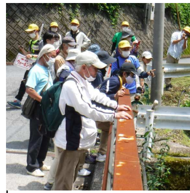
木弓滝と蛙岩の説明を聞きました