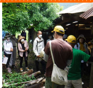
炭焼きの説明を聞きました