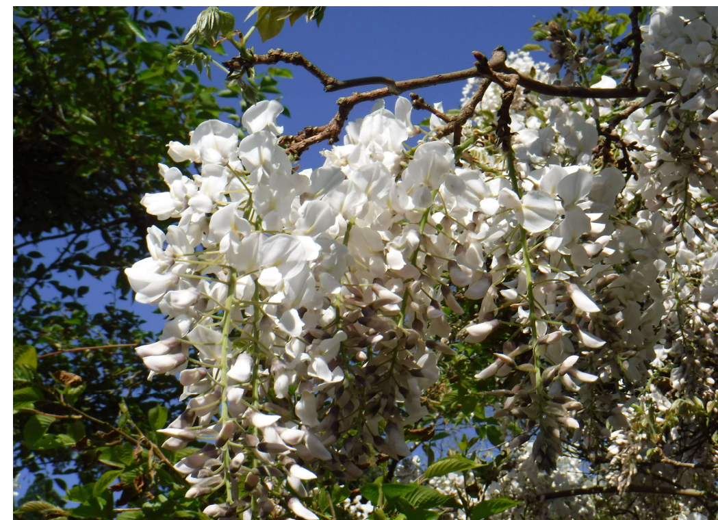
春ですね!! 虫秋の藤の花が綺麗に咲いてました ♪