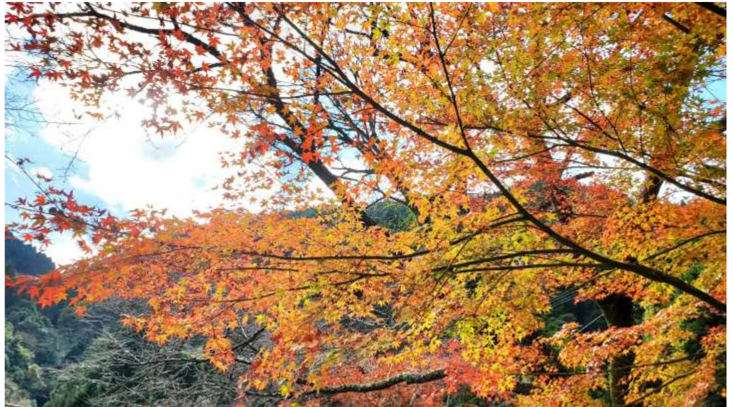
撮影場所:民宿ひろしげ 庭