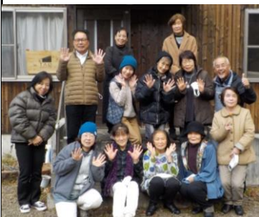
(写真を撮る時のみマスクを外しています)