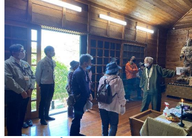
永興寺で説明を聞きました。