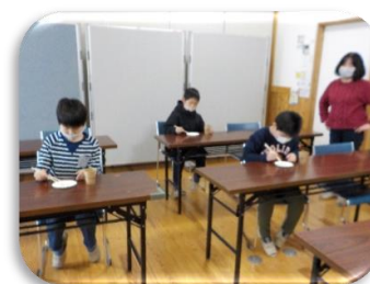
【写真を撮る前にマスクを外しました】