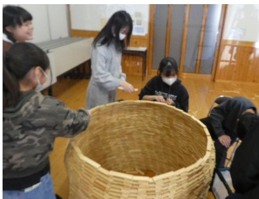
皆で協力して完成させよう！