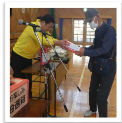
抽選会は今年も大盛況。