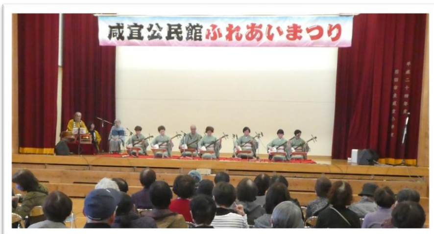
体育館ステージでは芸能発表会を。