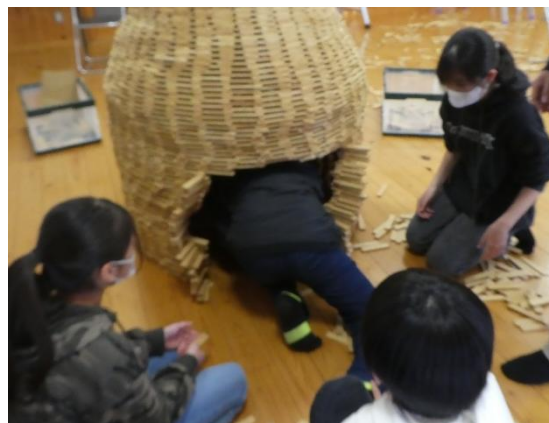
中には何人入れるかな～？