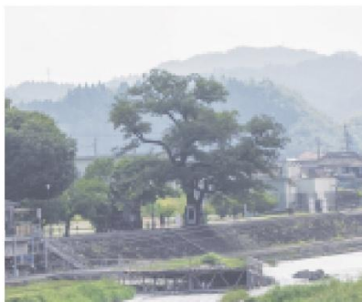
⑩竹田公園のムクの木