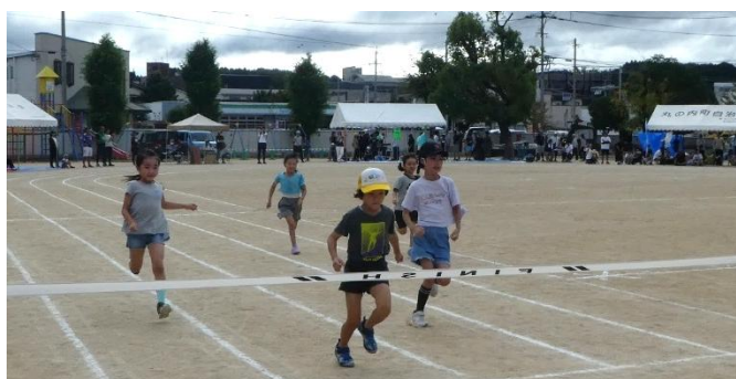
児童も参加！徒競走