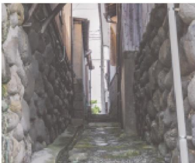
⑨川原へと続く背戸道