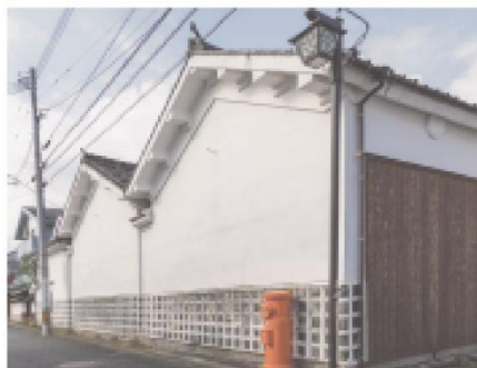
⑤白壁が並ぶ街並み

7月の半ばには日田祇園会が行われ、境内には樹齢300年を超える「叢雲の松」があります。