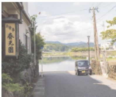
⑧隈町公園から望む三隈川