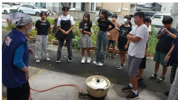
防災ご飯の実演中