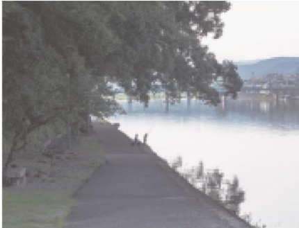
①亀山公園（日隈城跡）