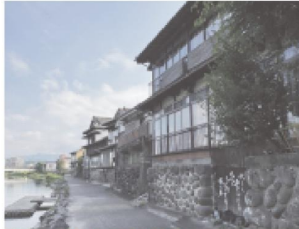
②庄手川沿いの商家跡

川沿いの建物は昔のままの姿を残し、石垣には川舟を入れていた納舟庫の扉もあります。