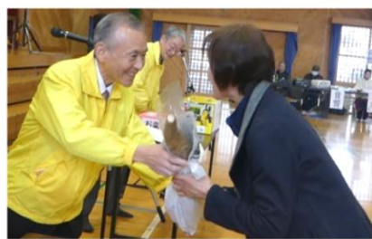
委員長からも特別賞の提供が♪