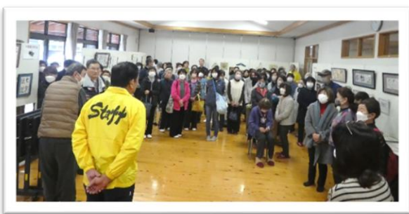
前日準備にも多数のご協力がありました。

3月2日に咸宜公民館ふれあいまつりを開催。当日は暖かかったものの雨が降り、見に来る方が少ないのでは？と心配されましたが、多くの来場者があり賑やかに開催することができました。関係者の皆さんをはじめ、会場にお越しいただいた方々に感謝いたします。