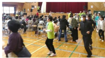
来場者と一緒にスロージョギング！